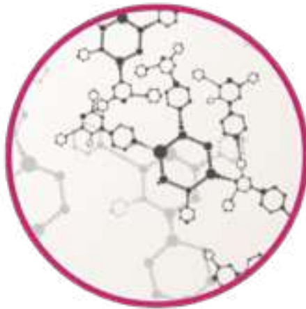
Аминокислота \beta -аланин