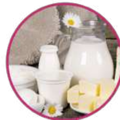
Сыр с плесенью