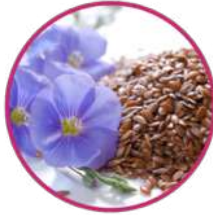
Лигнанный комплекс семян льна